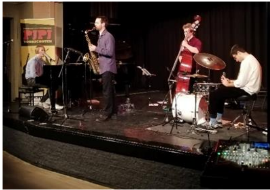
30 oktober 2021 Eigengrau