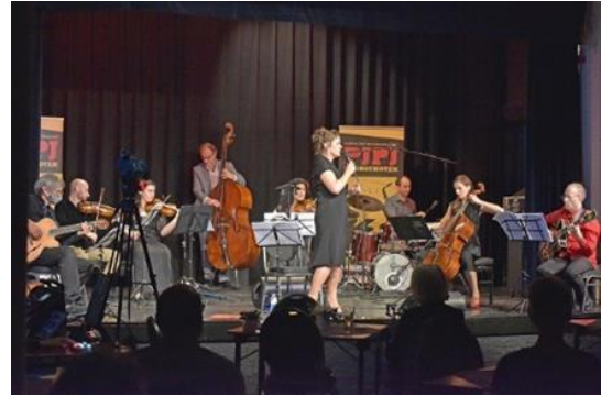
10 oktober 2020 Chamber9