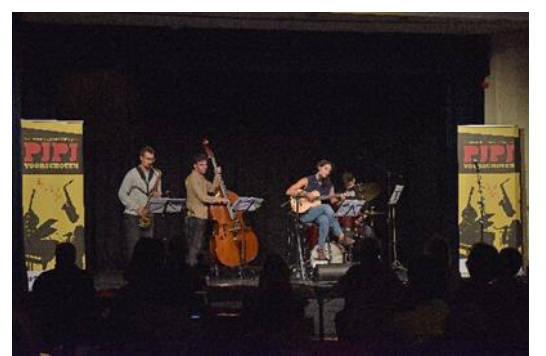
25 september 2021 Tengu Malina Bossa Nova Project