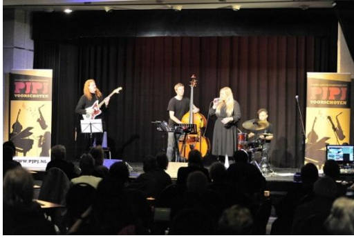
Bijzonder was ook het jazzconcert met het Alkul Quartet op 15 oktober 2022. Dit quartet liet moderne jazz en eigen composities horen.